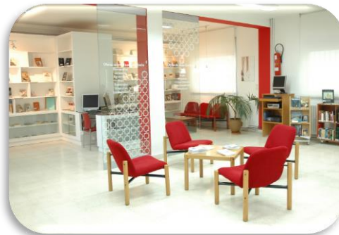
Biblioteca Juan Goytisolo de Tánger