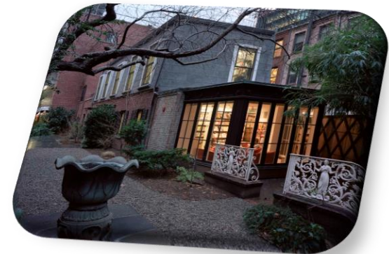
Biblioteca Jorge Luis Borges de Nueva York