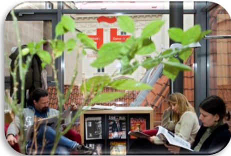
Biblioteca Carlos Fuentes de Praga