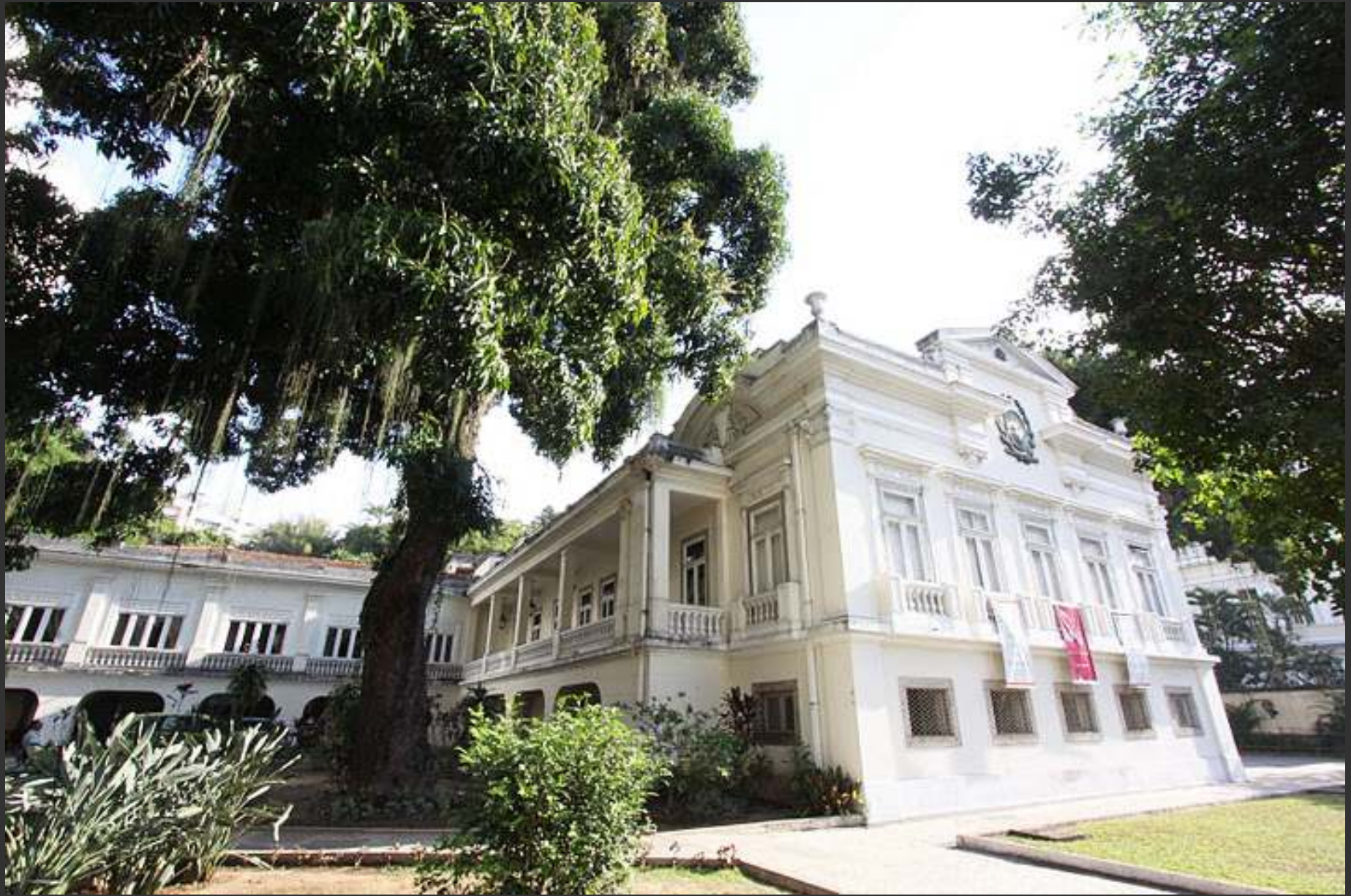
Museu do Ingá