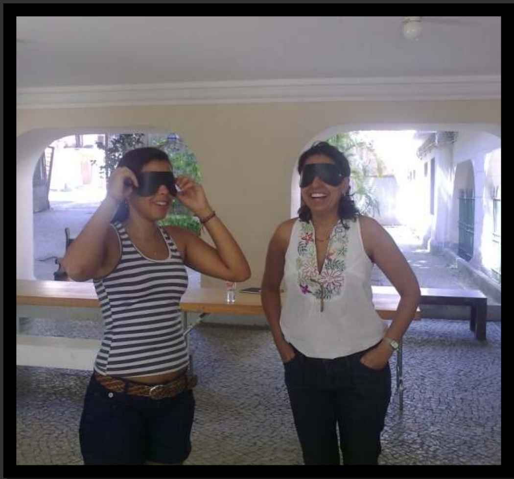
Encontro com educadores