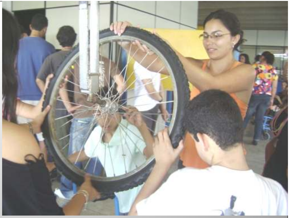
Casa da Descoberta